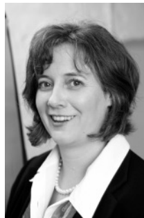
Sprechwissenschaftlerin (DGSS) Gründerin von active talk management